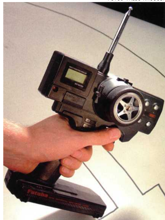
JUHTIMISKESKUS: Selle puldiga jagatakse mudelile korraldusi.